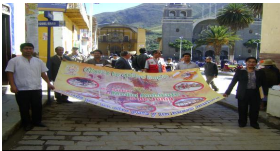
Pasacalle con autoridades por día del Medio Ambiente

AGROPECUARIA Y ARTESANAL VIRGEN DE LA PUERTA OTUZCO 2011 ” la misma que fue autorizada por Resolución Gerencial N° 100-2011-GRLL-GGR/GRSA.