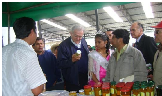
Presidente Regional comprobando la calidad de los productos de la Feria