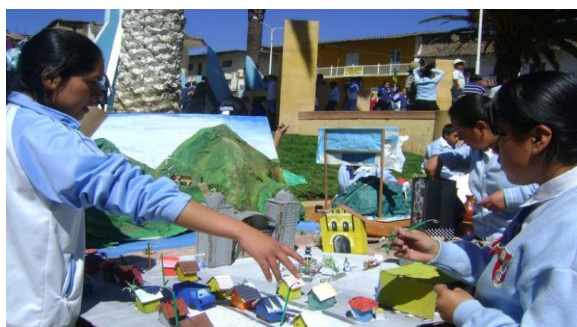
Maquetas de productos reciclables