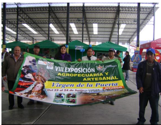
Comité de Feria con Banner